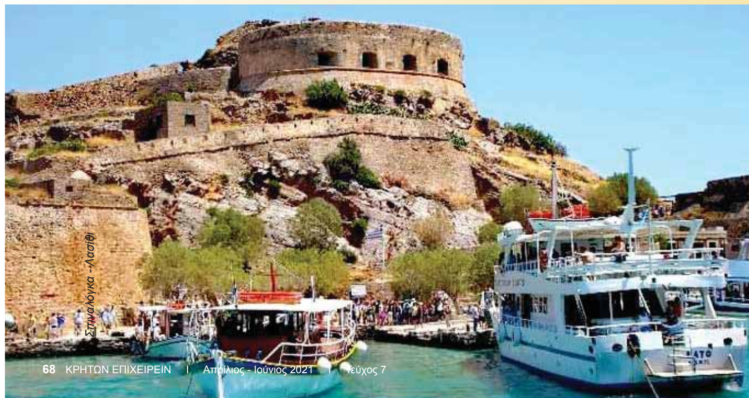
Σπιναλόγκα - Λασιθί

Η μεγαλύτερη ανταμοιβή ενός ξεναγού είναι όταν οι επισκέπτες, ενθουσιασμένοι και μαγεμένοι από τη χώρα του, του εκφράζουν το πόσο πολύ την αγάπησαν μέσα από τα μάτια του και τα λόγια του. Και αποφασίζουν να ξανάρθουν, ενώ γίνονται (με τη σειρά τους) και οι ίδιοι οι καλύτεροι πρεσβευτές του τόπου μας στην χώρα τους. Τότε ξέρουμε πως έχουμε πετύχει στο έργο μας.