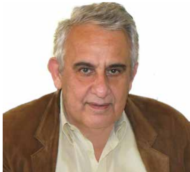
Αντώνης Παπαδεράκης Αντιπεριφερειάρχης Κρήτης Επιχειρηματικότητας, Εμπορίου, Καινοτομίας και Κοινωνικής Οικονομίας