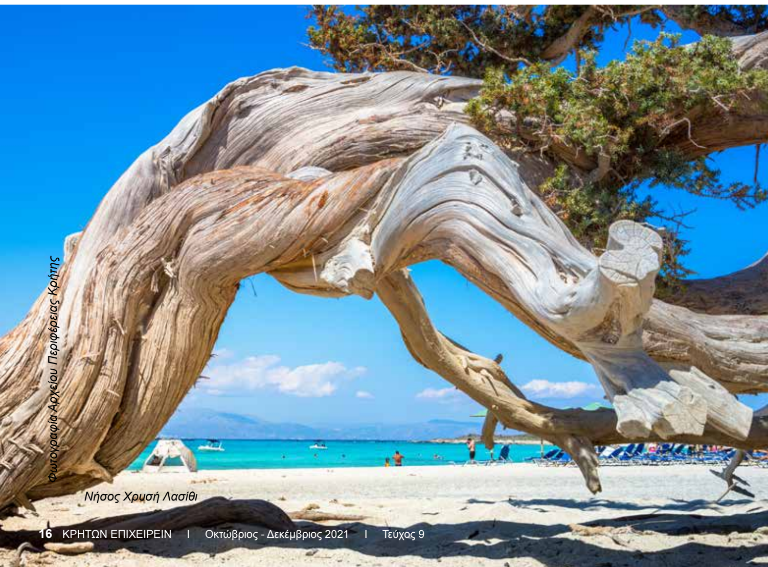
Φωτογραφία Αρχείου Περιφέρειας Κρήτης

Αυτή η χωρίς πόλεμο διατήρηση, μας «τιμωρεί» με ένα απίστευτο τρόπο. Πανδημία, ακραία φαινόμενα, φωτιές, σεισμοί κι ακόμα μεταναστευτικό, χρεωκοπίες, απειλούμενοι αφελληνισμοί ξενοδοχείων, το real estate στα υψηλά της 30ετίας, η καταστροφή και η συμφορά πλάι – πλάι με την ευκαιρία και την δυνατότητα να μη γυρίσουμε εκεί που ήμασταν αλλά ένα επίπεδο πάνω. Να μοιράσουμε πιο λογικά την «τράπουλα», για να παραμείνει στους Κρήτες, μαζί μ' όλο τον κόσμο γιατί δεν είμαι σίγουρος ότι η Μύκονος ανήκει στους Μυκονιάτες πια και η Σαντορίνη στους Σαντορινιούς ή αν στο κάστρο της