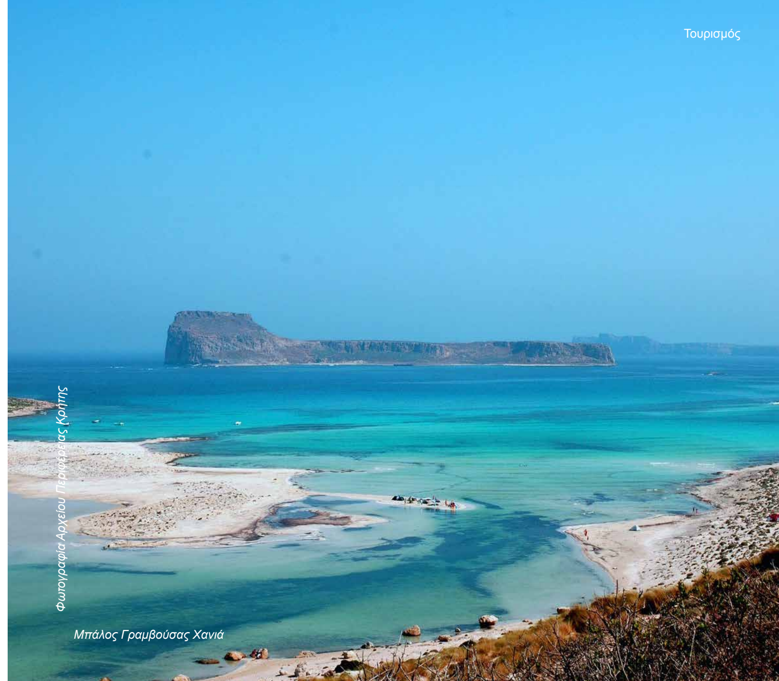
Μπάλος Γραμβούσας Χανιά

Σύμφωνα με τα παραπάνω, όλα δείχνουν, ότι η φετινή σεζόν θα τραβήξει μακριά και θα «σβήσει» όχι πριν το τέλος Νοεμβρίου, εκτός κι αν αντεπιτεθεί η Πανδημία συνεπικουρούμενη από το αντί-εμβολιαστικό «κίνημα»! Παράλληλα, εξαιρετικά πιθανό φαίνεται το 2022 να αποτελέσει το έτος «γέφυρα» προς το 2023 όπου και η Πανδημία θα έχει οριστικά ελεγχθεί, οι άνθρωποι όλου του κόσμου θα έχουν πάρει «πίσω τις ζωές τους» και οι οικονομίες θα οδεύουν προς την ανάκαμψη με ποικίλους ρυθμούς. Παρότι επιβεβαιωμένα, όταν