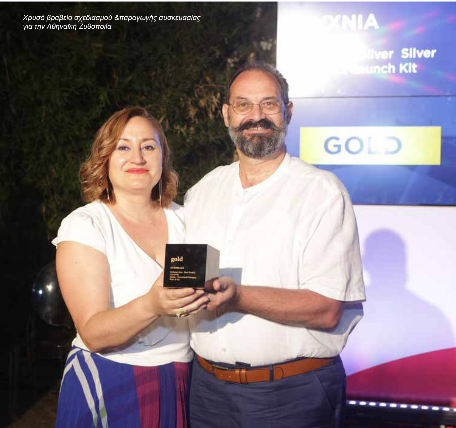
Χρυσό βραβείο σχεδιασμού & παραγωγής συσκευασίας για την Αθηναϊκή Ζυθοποιία