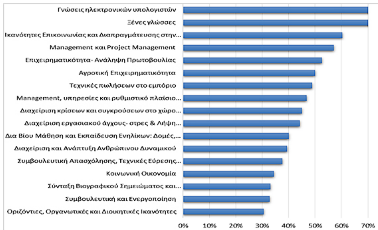
Γράφημα 3: Γνώμη εργατικού δυναμικού για μελλοντικά προγράμματα κατάρτισης – F01015

Στην ΕΕ2021, υψηλό συνεχίζει να είναι το ενδιαφέρον για Γνώσεις και δεξιότητες Αγροτική Επιχειρηματικότητα. Σε αντίθεση με την ΕΕ2019 όπου το αντικείμενο αυτό είχε την μεγαλύτερη αρνητική αντιμετώπιση, στην ΕΑΔ2020 φαίνεται ότι το ~50% του ανθρώπινου δυναμικού το επιζητά και θα το παρακολουθούσε.