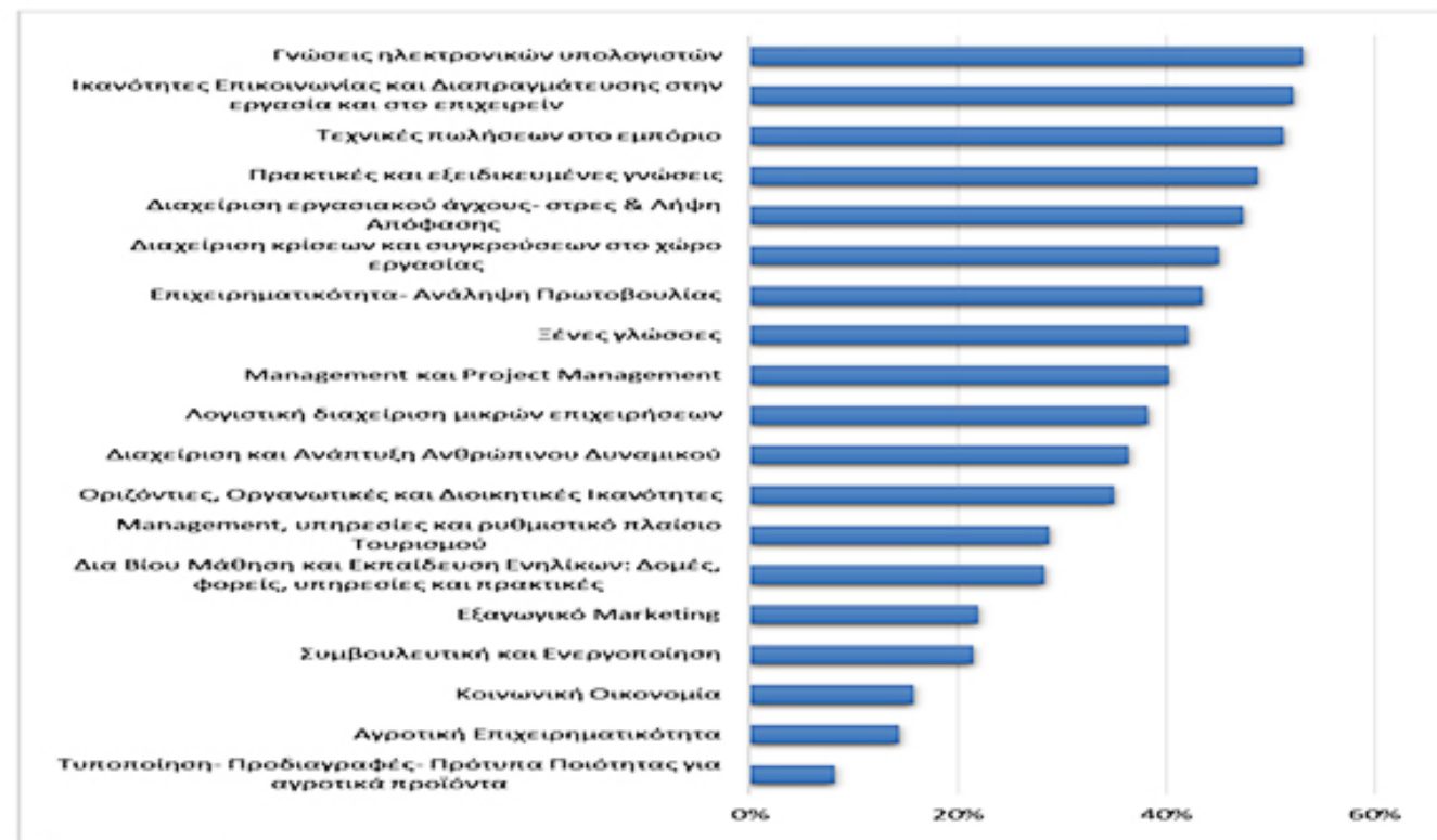
Γράφημα 1: Διατύπωση γνώμης επιχειρήσεων για αντικείμενα κατάρτισης – F02013