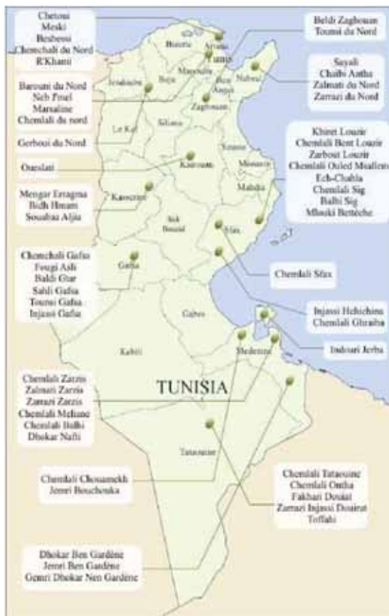
Κέντρα ελαιοπαραγωγής και ποικιλίες ελιάς

Η Tunησία καυχίεται ότι αποτελεί κέντρο ελαιοκαλλιέργειας και παραγωγής ελαιολάδου από τα χρόνια της αρχαίας Καρχηδόνας. Τούτο συνεχίστηκε και τους επόμενους αιώνες καθώς οι Ρωμαίοι αυτοκράτορες πήραν μέτρα ώστε η καλλιέργεια της ελιάς να επεκταθεί και η επαρχία να καταστεί το κέντρο ελαιοπαραγωγής της αυτοκρατορίας. Εν ολίγοις, το εμπόριο ελαιολάδου ήταν πάντα πηγή πλούτου για όλους τους πολιτισμούς που έχουν σημαδέψει την ιστορία της Tunησίας. Οι ελαιώνες υπάρχουν σε όλες τις περιοχές της Tunησίας, από βορρά προς νότο και από ανατολή προς δύση. Στα βόρεια της χώρας και σε ορισμένες περιοχές του κέντρου συνυπάρχουν με άλλες καλλιέργειες μονοετείς όπως τα δημητριακά ή οπωροφόρα δέντρα όπως εσπεριδοειδή, αμπέλια ή αμυγδαλιές, ενώ στα νότια, αποτελούν μονοκαλλιέργεια.