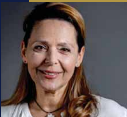
Αντιδήμαρχος Τουρισμού Δήμου Ρεθύμνης