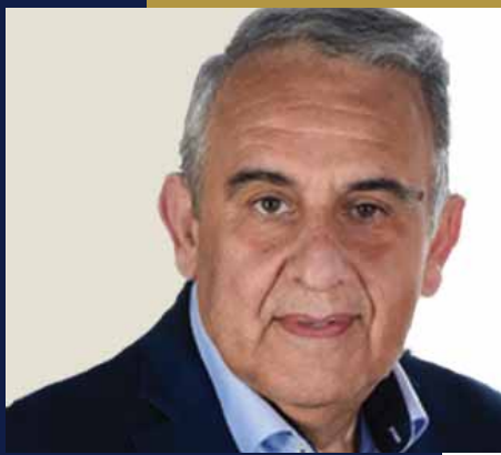
Αντιπεριφερειάρχης Επιχειρηματικότητας, Εμπορίου