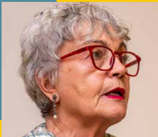
Πρέσβειρα Γυναικείας Επιχειρηματικότητας Κρήτης, Πρόεδρος Σοροπτιμιστικού Ομίλου Ηρακλείου «ΑΡΕΤΟΥΣΑ».