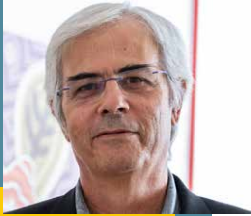
Αναπληρωτής Καθηγητής Τμήμα Διοίκησης Επιχειρήσεων και Τουρισμού ΕΛΜΕΠΑ