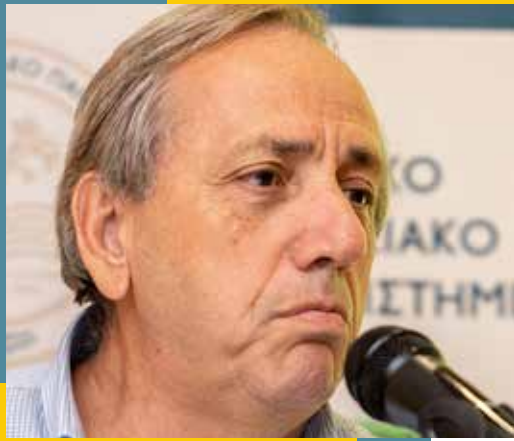
Αερολιμενάρχης Κρατικού Αερολιμένα Ηρακλείου