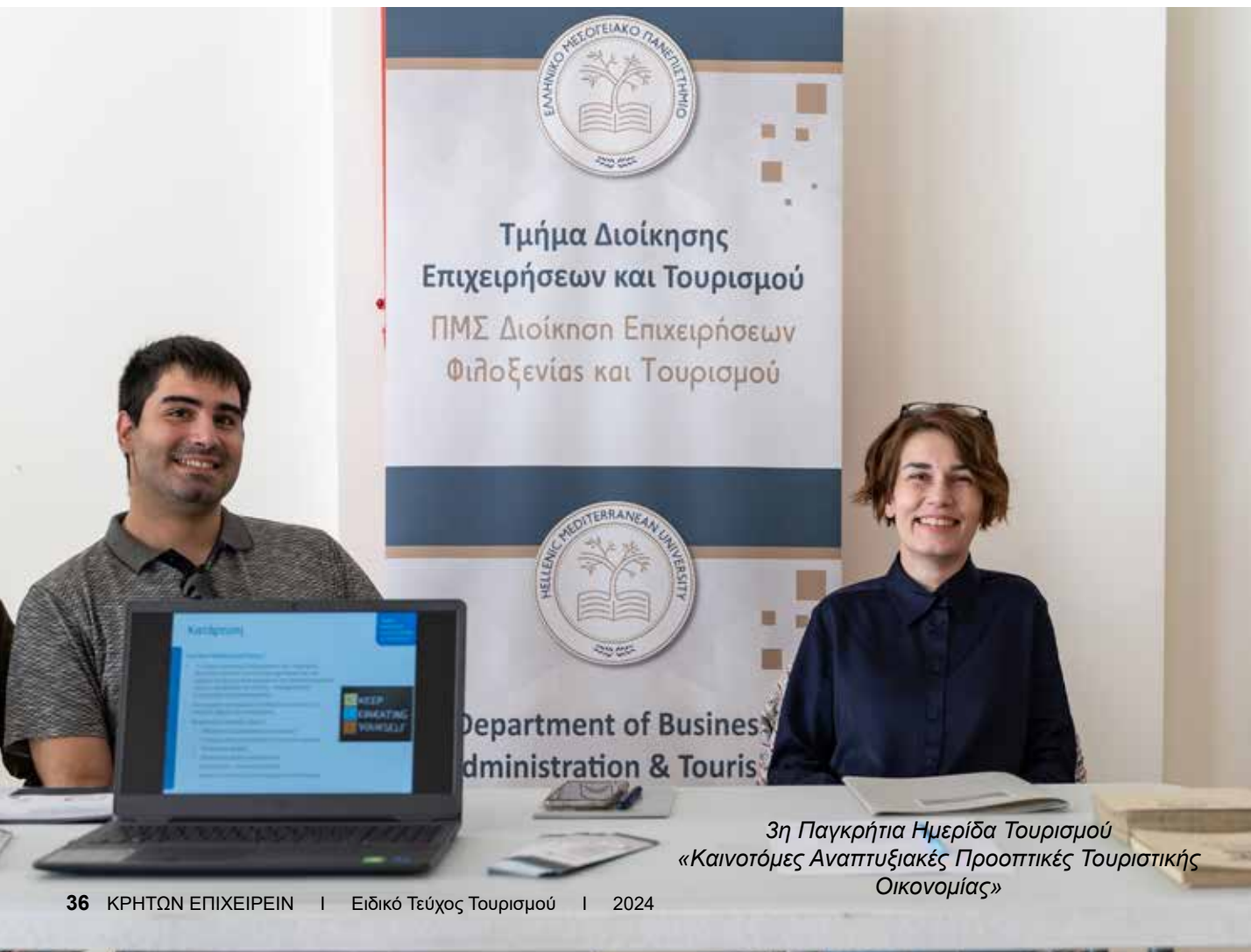
3η Παγκρήτια Ημερίδα Τουρισμού «Καινοτόμες Αναπτυξιακές Προοπτικές Τουριστικής Οικονομίας»

για τη φήμη και την εικόνα των τουριστικών προορισμών είναι μεγάλο – ιδιαίτερα για περιοχές που η οικονομία τους εξαρτάται σημαντικά από τον τουρισμό, όπως η Κρήτη – σε μία εποχή που ο ανταγωνισμός ανάμεσα στους προορισμούς είναι ιδιαίτερα έντονος. Η ευζωία των ζώων συντροφιάς αν και μέχρι σήμερα δεν συμπεριλαμβάνονταν σε καμία ατζέντα των οργανισμών διαχείρισης προορισμού, θα πρέπει να γίνει κατανοητό ότι πλέον πρέπει να θεωρείται μέρος της οικονομικής εξίσωσης για την τουριστική βιομηχανία. Κάποιοι τουριστικές επιχειρήσεις έχουν αρχίσει να κατανοούν τα οφέλη εντάσσοντας την περίθαλψη και φροντίδα αδέσποτων ζώων συντροφιάς στις ενέργειες εταιρικής κοινωνικής ευθύνης τους. Η έμφαση στην ευζωία των ζώων συντροφιάς θα μπορούσε να λειτουργήσει ως ανταγωνιστικό πλεονέκτημα για τους τουριστικούς προορισμούς προσελκύοντας χιλιάδες ευαισθητοποιημένους τουρίστες, αλλά ίσως ακόμα πιο σημαντικό, με τη βοήθεια της τουριστικής βιομηχανίας, οι γάτες και τα σκυλιά που υποφέρουν στους δημοφιλείς τουριστικούς προορισμούς σε όλο τον κόσμο θα αποκτήσουν επιτέλους μια ευκαιρία για τη ζωή που τους αξίζει.