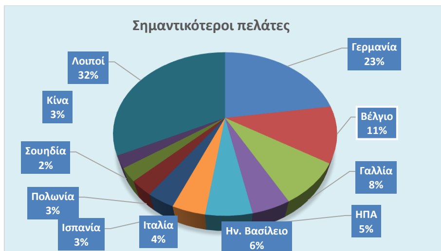
Πίνακας 6: 10 Σημαντικότεροι προμηθευτές Ολλανδίας και η θέση της Ελλάδας – 2023