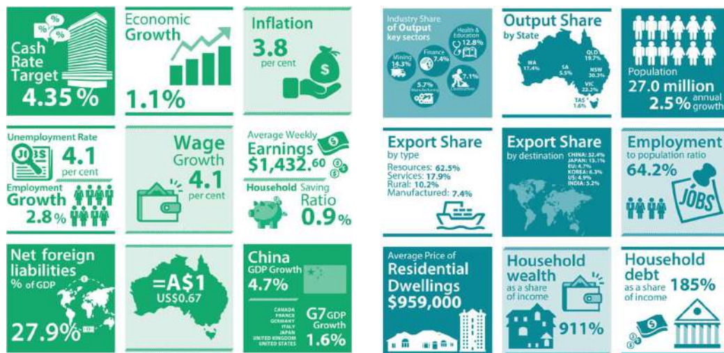
ΠΙΝΑΚΑΣ 3 ΤΡΕΧΟΥΣΑ ΑΠΟΤΥΠΩΣΗ ΑΥΣΤΡΑΛΙΑΝΗΣ ΟΙΚΟΝΟΜΙΑΣ