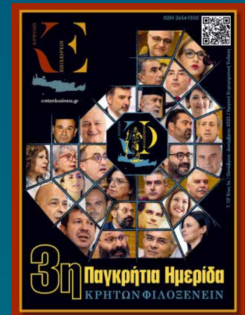
3η Ημερίδα Ηράκλειο