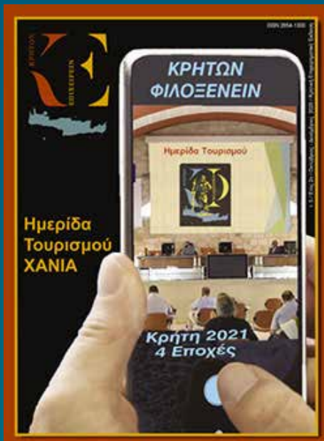
1η Ημερίδα Χανιά