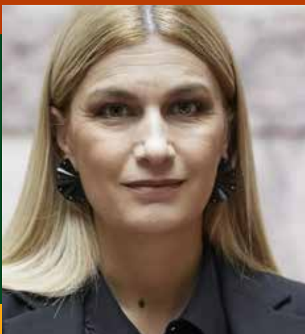
Σεβαστή (Ξέβη) Βολουδάκη Υφυπουργός Μετανάστευσης & Ασύλου

Αξιότιμοι διοργανωτές, Κυρίες και κύριοι,