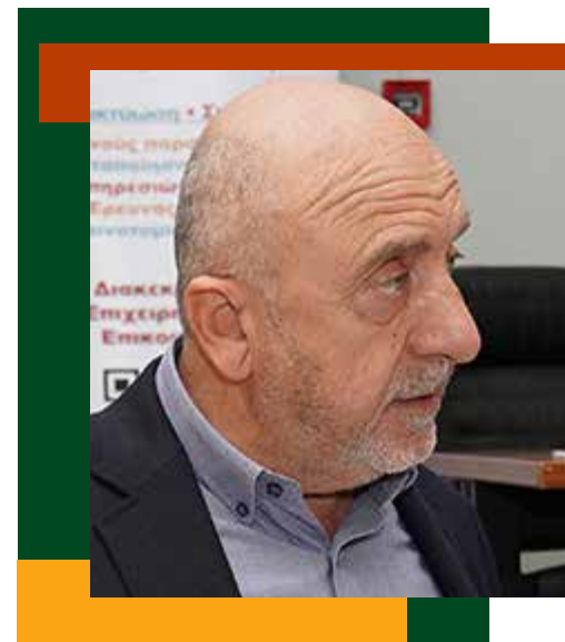
Ιωάννης Ζερβός Δήμαρχος Σφακίων

Τα τελευταία χρόνια, οι εξωστρεφείς Χανιώτες επιχειρηματίες και η πολύπειρη παραγωγή μας, με σχέδιο, συνεργασία και σκληρή δουλειά, κατορθώνουμε να υπερβούμε τα εμπόδια των αλληπάλληλων κρίσεων, κατακτώντας νέες διεθνείς αγορές και υψηλούς εξαγωγικούς ρυθμούς ανάπτυξης. Οι επιχειρηματίες των Χανίων συνεχίζουμε να πρωτοπορούμε και να συνεργαζόμαστε στενά με τους παραγωγούς του τόπου μας, ώστε να δημιουργήσουμε όλοι μαζί ένα ακόμη πιο συμπαγές αναπτυξιακό μέτωπο υπεραξίας για τον διατροφικό πλούτο της χανιώτικης γης.