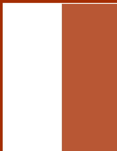
1/2 Εσωτερική 10 εκ. X 27 εκ.