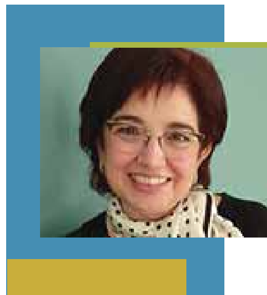
Επίκουρος Καθηγήτρια, Διευθύντρια Α.Σ.Τ.Ε. Κρήτης